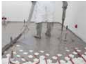
Séchage de chape